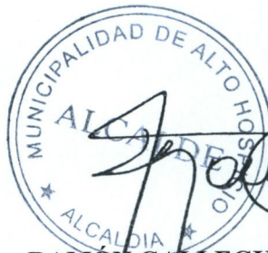
RAMÓN GALLEGUILLOS CASTILLO ALCALDE

El presente Convenio de Transferencia de Recursos se suscribe en seis ejemplares del mismo tenor y validez, quedando uno en poder de la Ilustre Municipalidad de Alto Hospicio y cinco para el Gobierno Regional de Tarapacá .